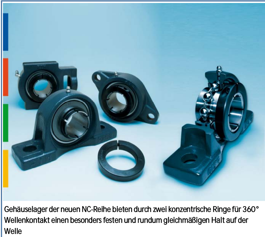
Gehäuselager der neuen NC-Reihe bieten durch zwei konzentrische Ringe für 360° Wellenkontakt einen besonders festen und rundum gleichmäßigen Halt auf der Welle

Findling bietet alle gängigen Stehlager- (NCP-...) und diverse Flanschlagerausführungen (NCFL-...) in je neun Baugrößen für Wellendurchmesser von 20 bis 60 Millimeter an. Die La-